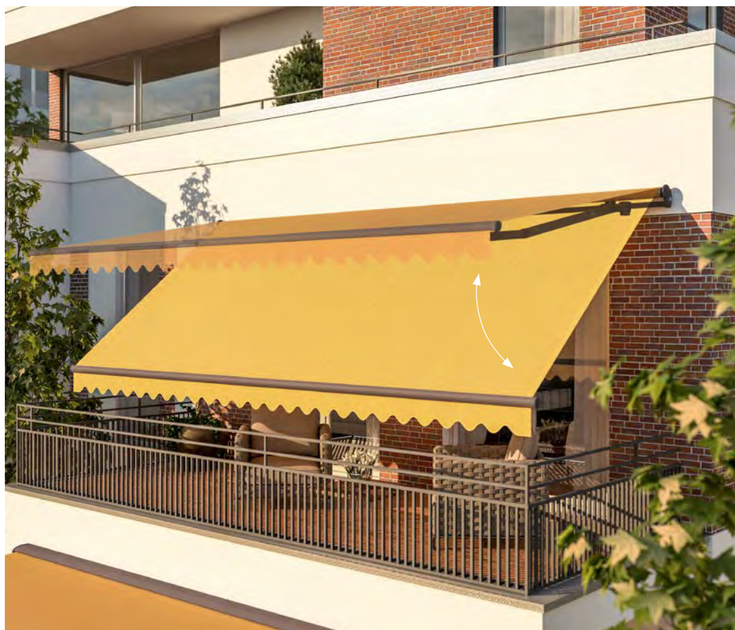
Lewens Matik (wyposażenie dodatkowe)

Dotatkowa przekładnia korbowa umożliwia płynną regulację nachylenia markizy, a tym samym dostosowanie do położenia słońca.